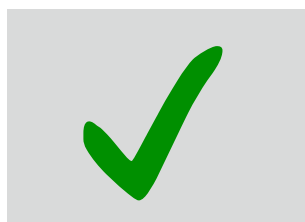
Umlaufend 5 mm Beschnitt -ohne Schnittmarken-